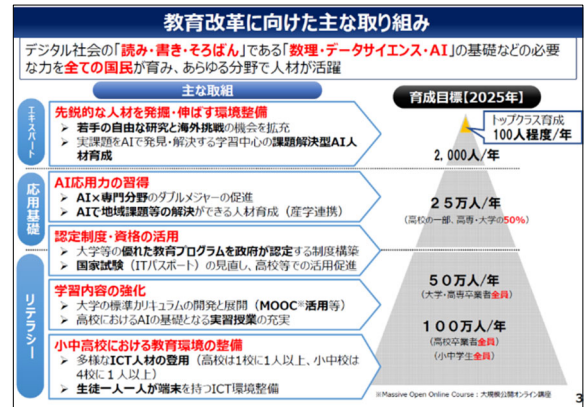
図 1 AI 戦略 2019

政府は、Society5.0 社会に向け、AI 戦略・AI 人材育成方針を定めた。これに合わせて文部科学省は 2025 年に達成しておきたい目標を図 1 のように示している。これを基に「数理・データサイエンス・AI 教育プログラム認定制度実施要綱」を定めている。この要綱には図 1 に示されているように「リテラシー・応用基礎・エキスパート」の 3 つのレベルが示されている。