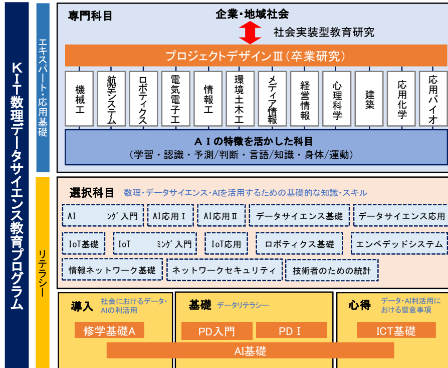
図 2 KIT 数理データサイエンス教育プログラム全体像

図 2 に本プログラムの全体像を示す。本プログラムは 2020 年度以降の入学生を対象とし、現在は 2020・2021 年度カリキュラム生に向けたプログラムとなっている。