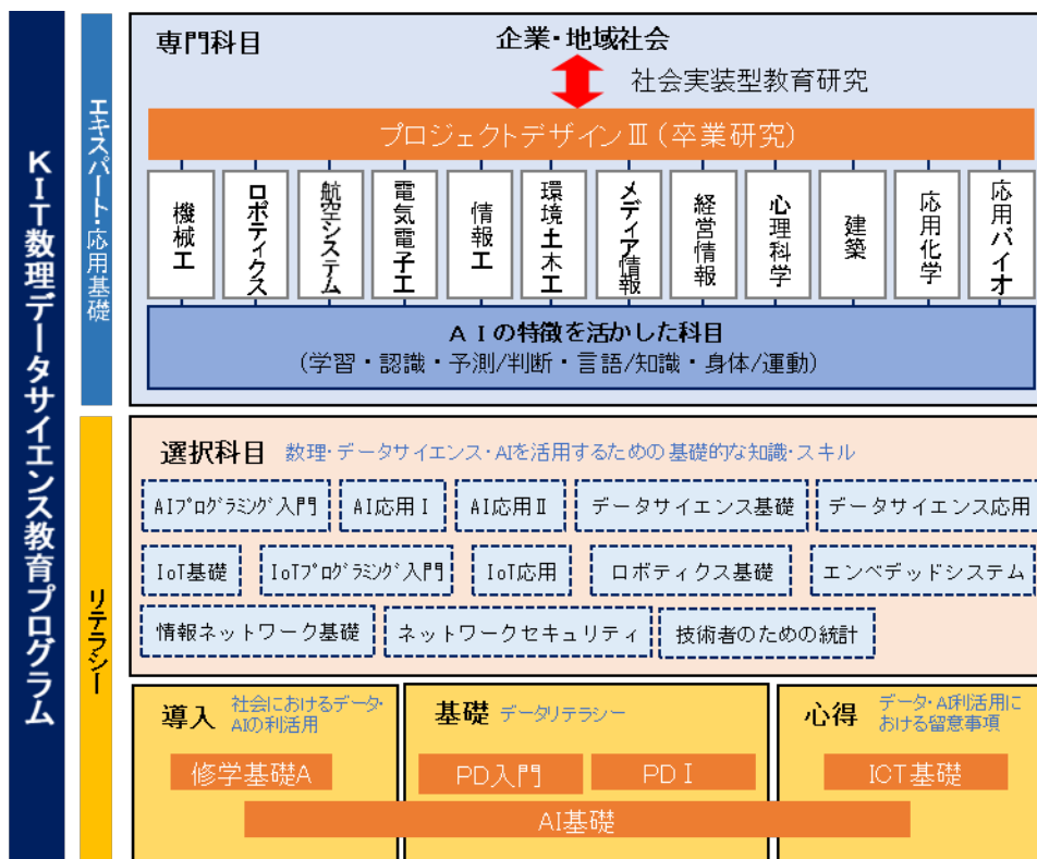
図2 KIT 数理データサイエンス教育プログラム全体像 (2020・2021年度入学生)

図2に本プログラムの全体像を示す。本プログラムは2020年度以降の入学生を対象とし、現在は2020年度入学生・2021年度入学生に向けたプログラムとなっている。